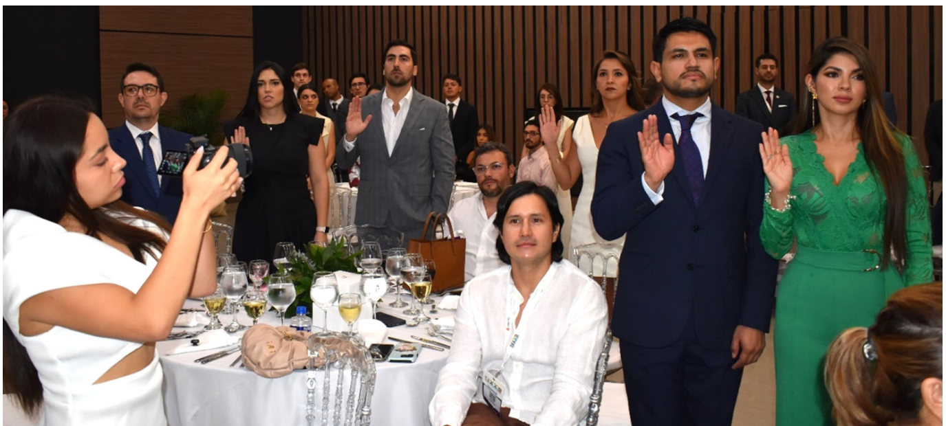
Nuevos miembros de la SCCP, juran conocimiento y fidelidad a los estatutos.