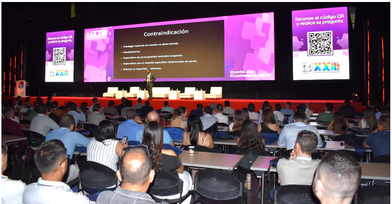
Final de sesión en el salón principal.