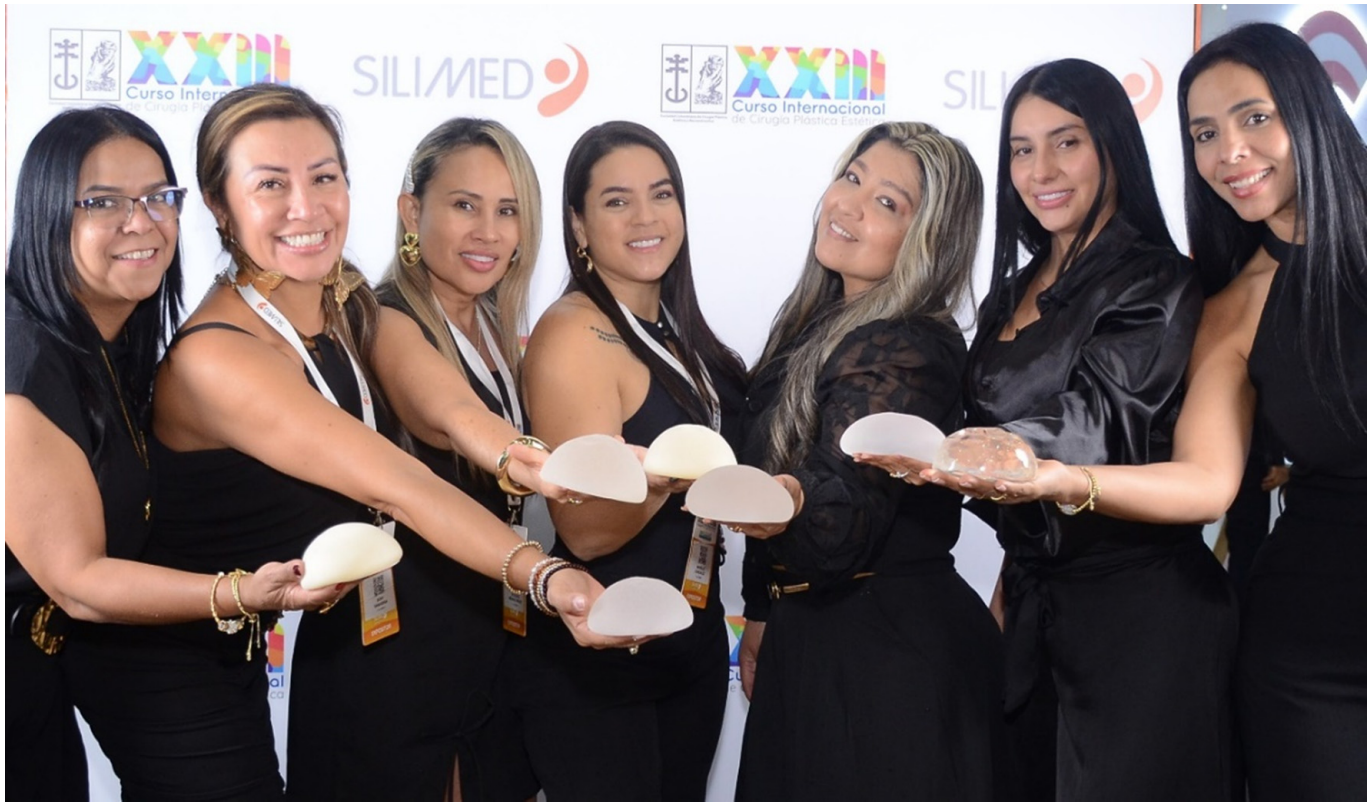
Las representantes del más fiel anunciador de la revista.