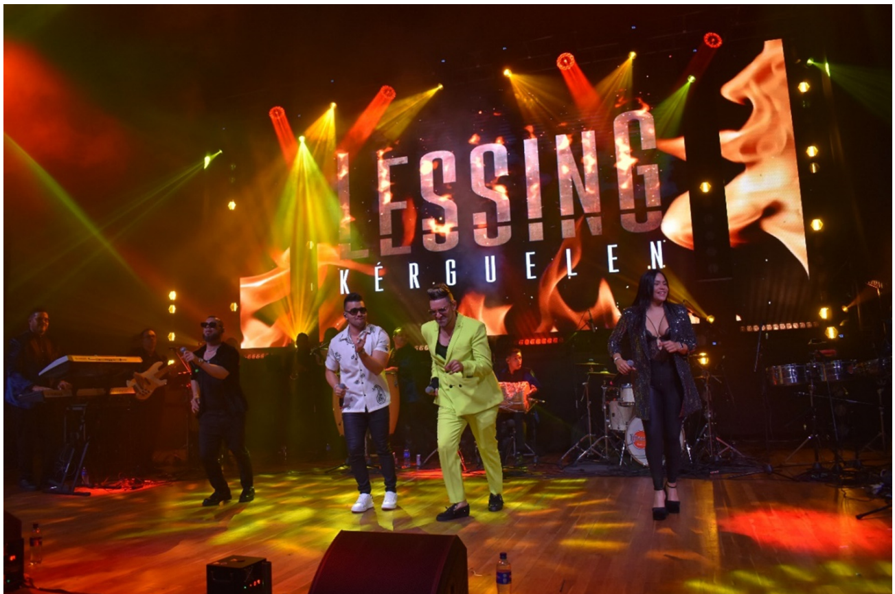
Alegría barranquillera la noche de integración en el Country Club.