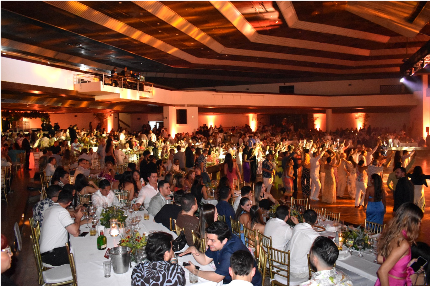
La sociedad celebra el éxito del curso.