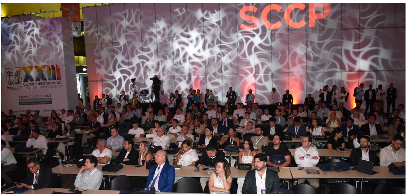
Parte del auditorio, Salón 1.