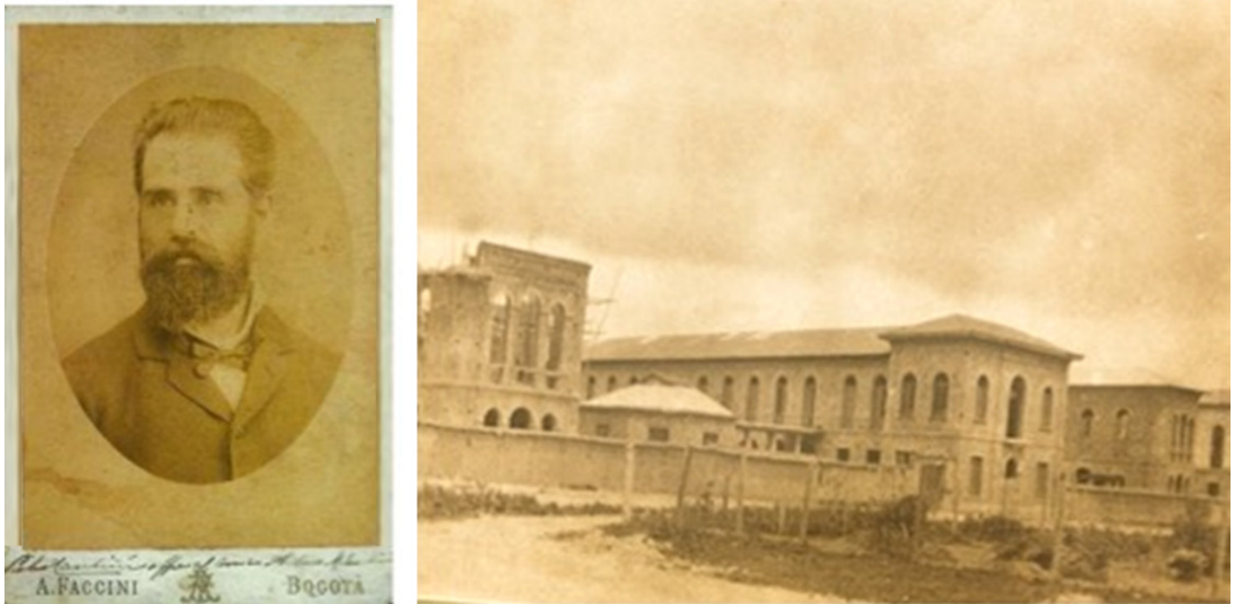
Figura 1. fotografía en albúmina del Arquitecto Pietro Cantini, por Antonio Faccini 1881 y, fotografía de las obras del Hospital de San José 1915.

La historia del Servicio de Cirugía Plástica en el Hospital de San José, se inicia con una figura que es común a los servicios de Cirugía Plástica y Otorrinolaringología, la del doctor Arcadio Forero Gutiérrez (Figura 2). El doctor Forero nació en Garagoa, Boyacá en octubre