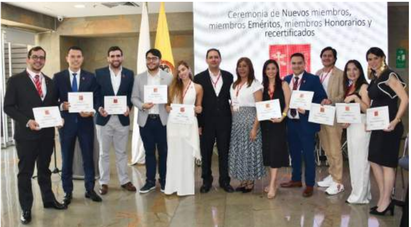
Los recién ingresados exhiben orgullosos sus diplomas y emblemas.