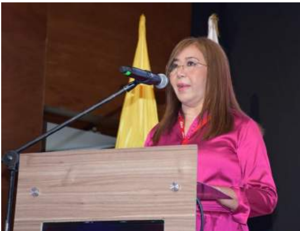
La doctora Damaris Romero Chamorro, presidenta del congreso y de la SCCP, instala el evento, la mañana del 23 de octubre en el Centro de Convenciones Plaza Mayor.