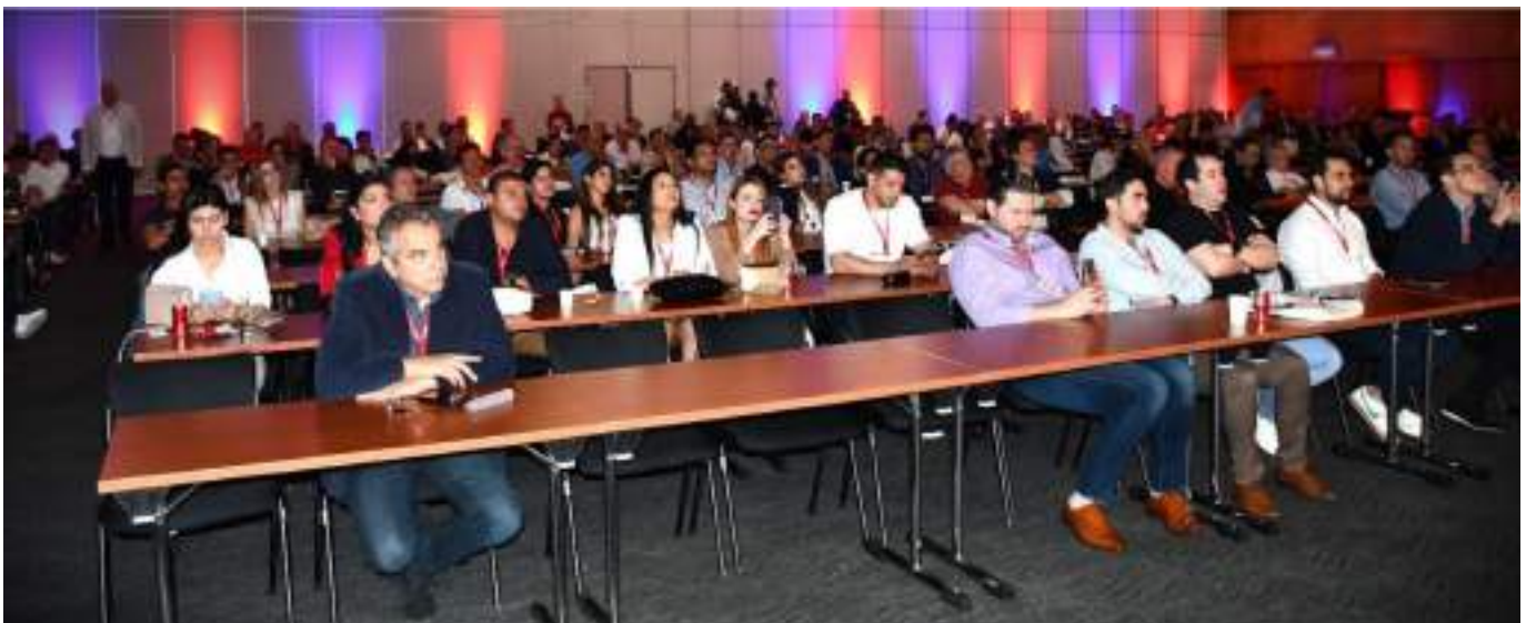
Atención en el Salón 1.