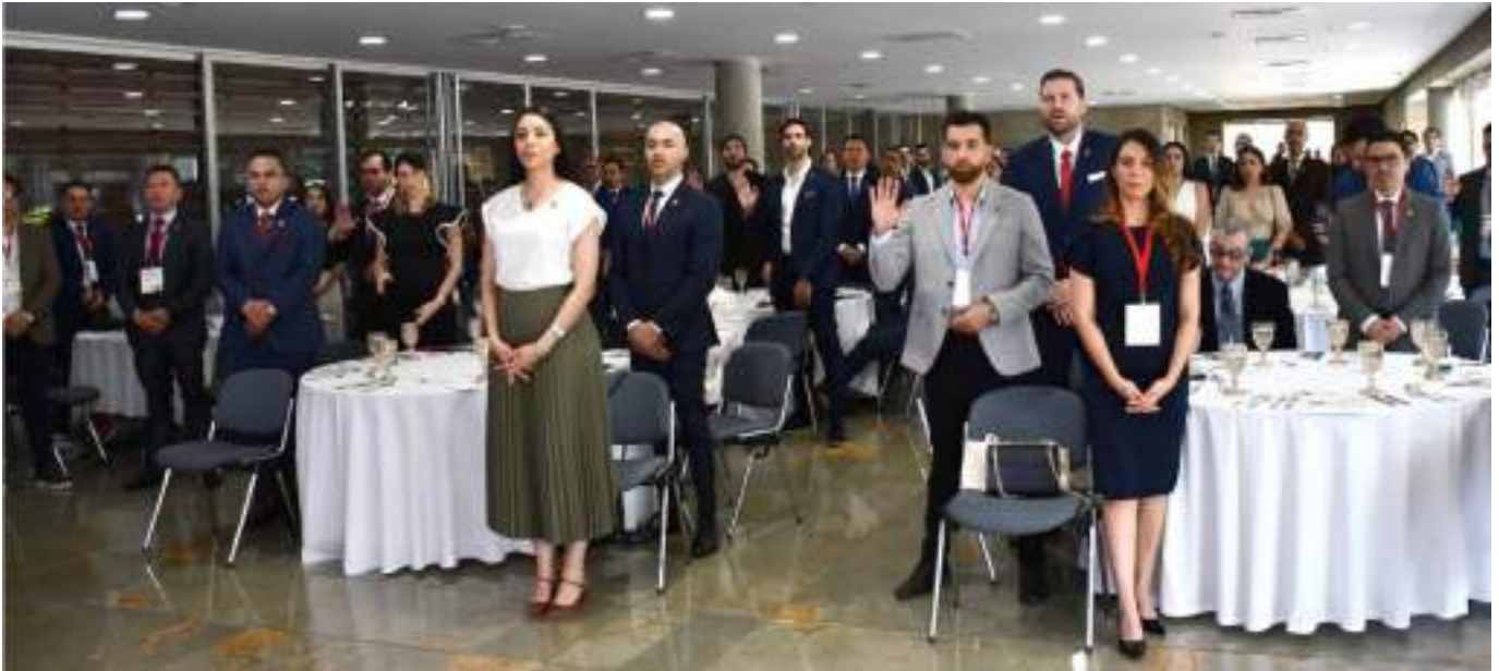
Los 59 nuevos miembros de número de la SCCP juran lealtad, conocimiento y cumplimiento de los estatutos.