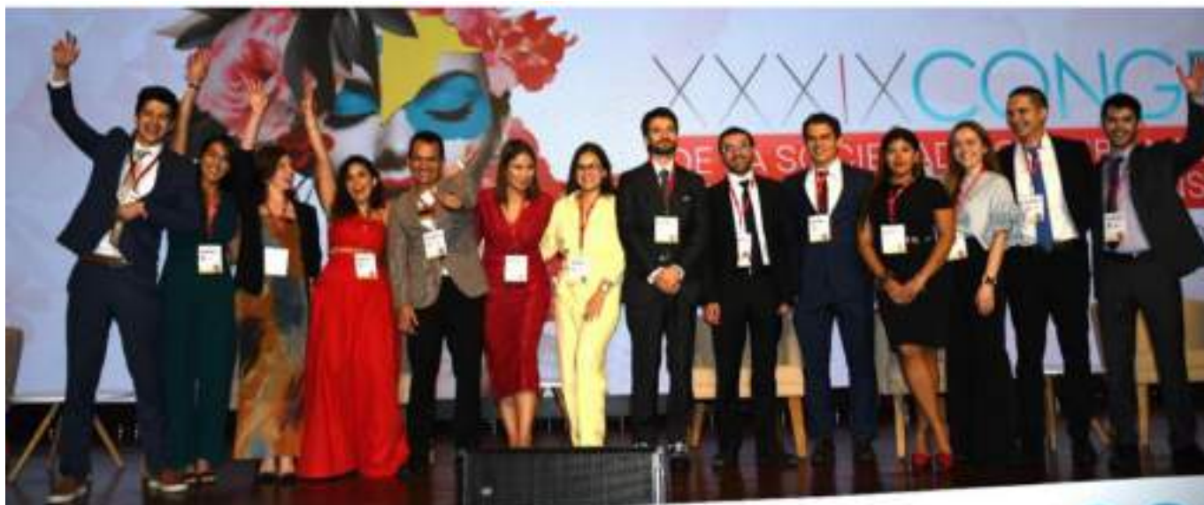
Los residentes participantes celebran al término de su Concurso Nacional Premio Arcadio Forero.